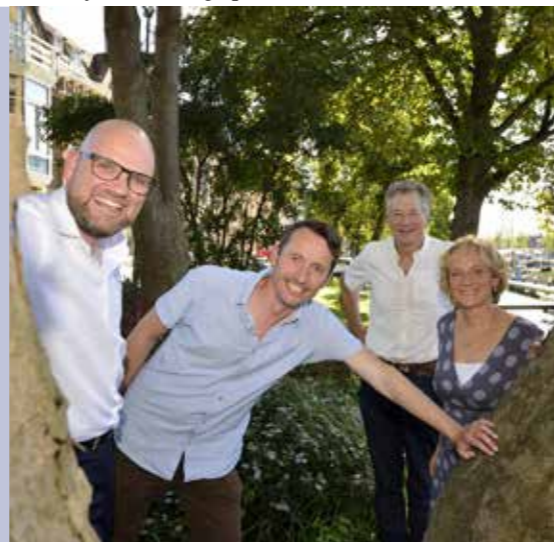
Initiatiefnemers Singelpark Gouda

naast groeit het besef dat bij een goed wegontwerp bomen juist veiligheid verhogend kunnen werken. Ons Mooi Epe is nog lang niet klaar met het project. Toch is er al veel bereikt. Los van het feit dat er veel bomen behouden blijven, zijn zowel de Epenaren als de statenleden anders naar bomen gaan kijken. 🌳